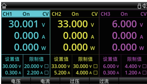
液晶显示交互界面