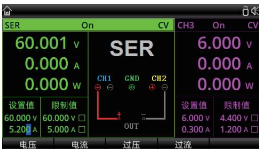
串并联一键设置: 串联输出