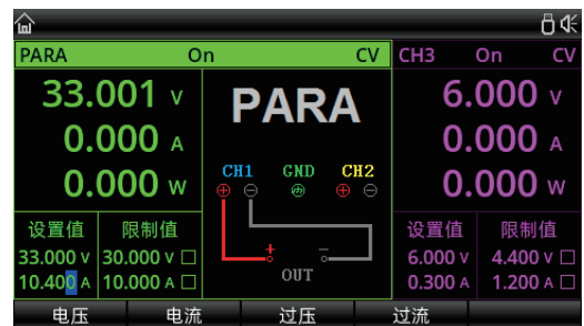
串并联一键设置: 并联输出